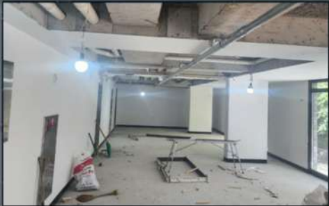
[BEFORE-철거직후 OUTDATED SHELL]