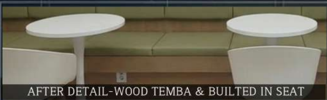
AFTER DETAIL-WOOD TEMBA & BUILT IN SEAT