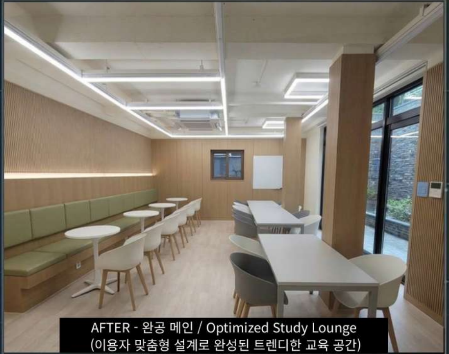
AFTER - 완공 메인 / Optimized Study Lounge (이용자 맞춤형 설계로 완성된 트렌디한 교육 공간)