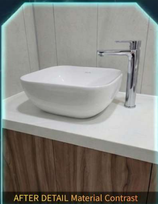
AFTER DETAIL Material Contrast Wood & Stone