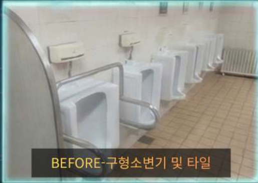
BEFORE-구형소변기 및 타일