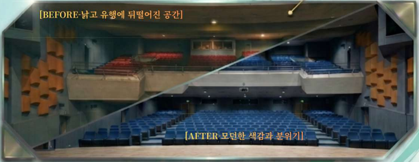
[AFTER-모던한 색감과 분위기]