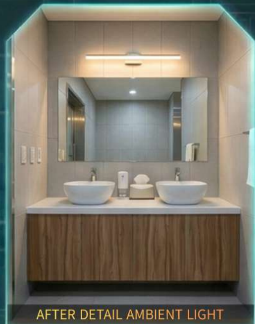
AFTER DETAIL AMBIENT LIGHT Symmetric Balance & Mood