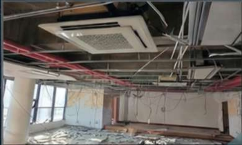
[BEFORE-철거직후 OUTDATED SHELL]