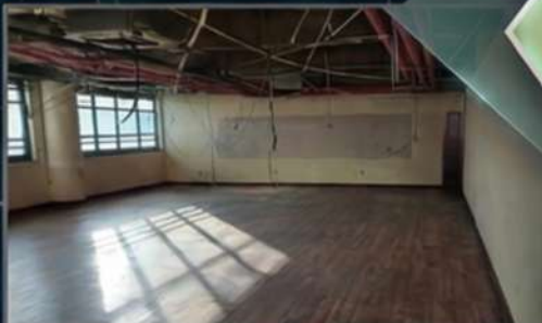
[BEFORE-공사중 OUTDATED SHELL]