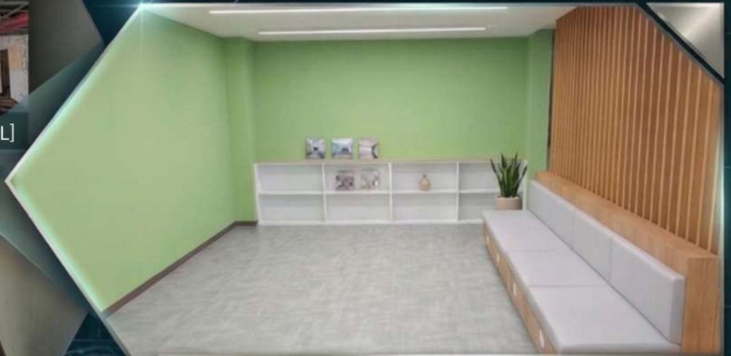
AFTER - 완공 메인 /Future ready system Lounge (편안하고 조용한,휴게공간과 조명과조화를 이루는 수직설계시공)