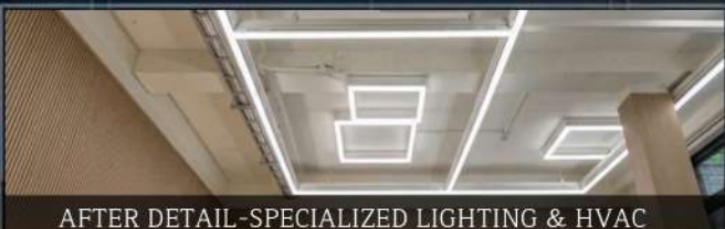
AFTER DETAIL-SPECIALIZED LIGHTING & HVAC