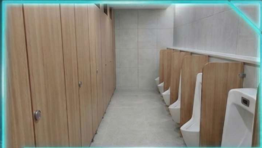
AFTER-완공메인 / Modern & Sanitary Space 공공기관 기준에 부합하는 위생적이고 맑은환경 조성