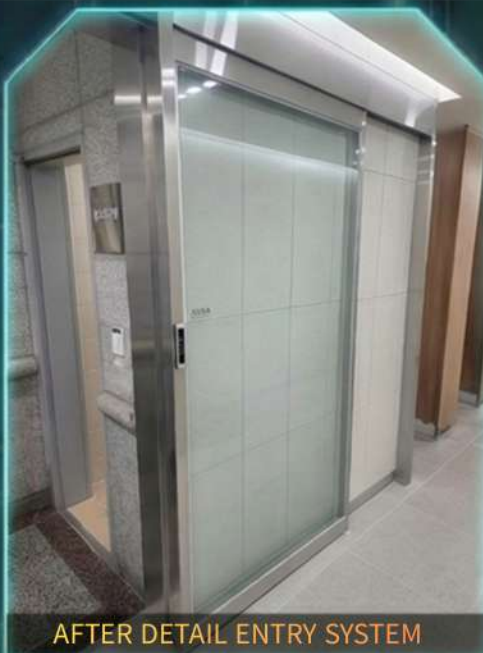
AFTER DETAIL ENTRY SYSTEM Seamless Access Control