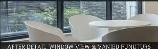
AFTER DETAIL-WINDOW VIEW & VANIED FUNUTURS