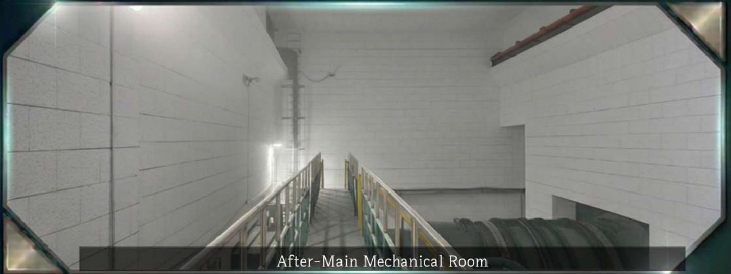
After-Main Mechanical Room

특수 방습 마감으로 결로 억제 및 쾌적한 지하 작업 환경 조성 설비 시인성 극대화 및 정밀 마감으로 유지보수 효율 증대성 증대